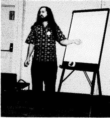
講演する Stallman 氏