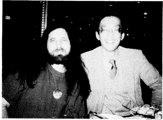
Legal Seafood にて (Stallman 氏と筆者)

なぜ Incompatible Time Sharing System という名前がついたのでしょうか？ それは、当時、IBM マシンの上に作られた CTSS (Compatible Time Sharing System) に対する「あてこすり」でした。「コンパティブルタイムシェアリングシステムより、我々のインコンパティブルタイムシェアリングシステムのほうがコンパティブルだ」という主張です。CTSS は MULTICS に発展し、ITS はその後、Digital Equipment 社のコンピュータに大きな影響を与えます。彼らにとって、CTSS は最悪のかっこう悪いシステム